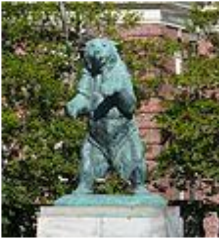
Brown Bear (1923) by Eli Harvey on College Green on Brown University's Campus in Providence, RI.