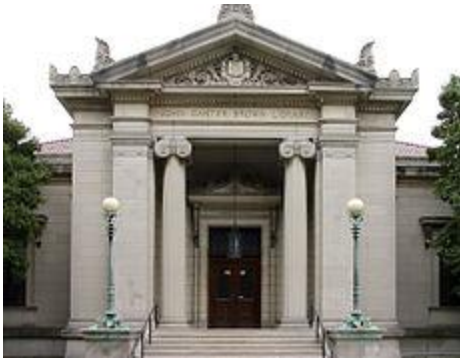
존 카터 브라운 도서관 (John Carter Brown Library)

80 년간, 남자대학이었던 브라운대학과 병행되어 운영되다가 1971 년에 들어서면서 브라운대학과 합병하여 단일 남녀공학 대학으로 새로운 출범을 하게 되었다.