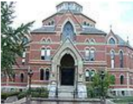
Brown University — Robinson Hall. Built in 1878, designed by William Appleton Potter in the Gothic revival style.