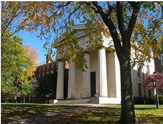
매닝 홀 (Manning Hall)